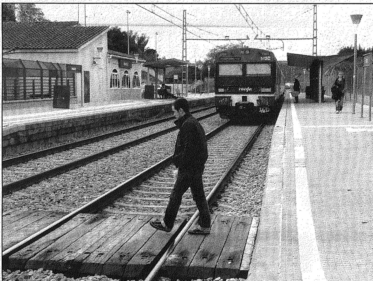
El servei de Rodalies funcionarà en un 66 per cent avui, divendres, i Mitja distància en un 65 per cent (AdBM)

D'altra banda, la Plataforma d'usuaris Renfe de Mitja Distància ha reprès la seva activitat demanant