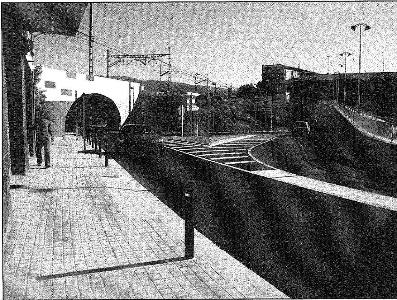
Els treballs de construcció del túnel arriben al seu punt i final amb diversos anys de demora (AdBM)

La conclusió d'aquestes obres ha estat llargament esperada pels veïns del municipi ja que el procés constructiu del túnel ha estat més llarg del que es preveia inicialment, amb diverses aturades de