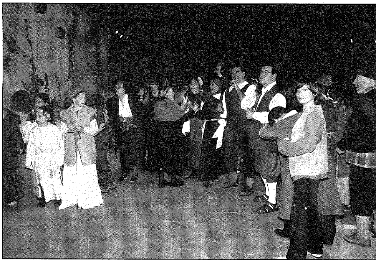
Tramoia i Trocateatre ja van col·laborar en l'obra 'Llegenda d'una espasa' el passat Sant Jordi

Segons el director "tenia un guió molt interessant, que a més estava més de moda que mai". Per aquest motiu les companyies van