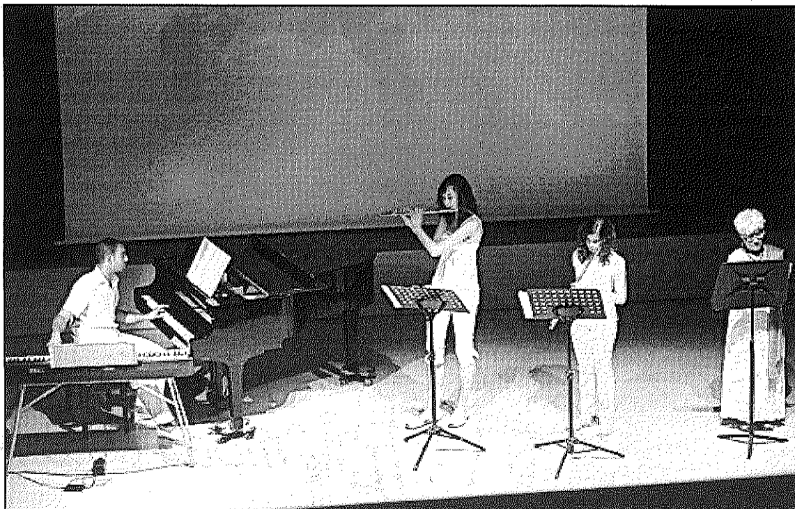
Els concerts de '...a l'olivera' se celebren els divendres a la sala petita de l'Ateneu (L'AdBM)

Avui, divendres, a les 9 del vespre, s'ofereix el segon dels concerts '...a l'olivera'