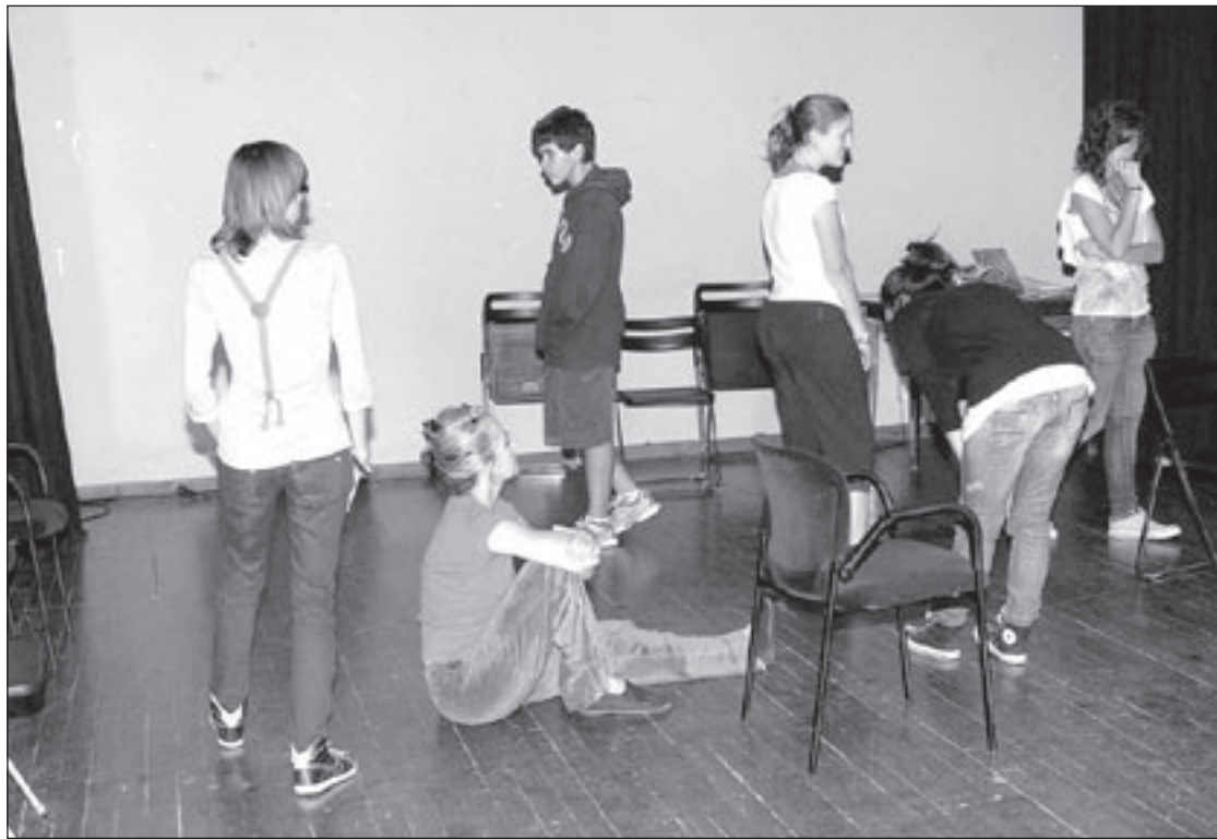
Una de les sessions formatives que es porten a terme al Centre Municipal d'Expressió de Sant Celoni

Els responsables del centre municipal remarquen que