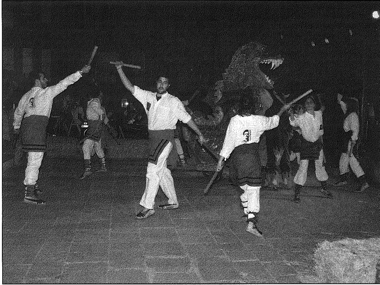
La Colla Bastonera Quico Sabaté en la seva intervenció a l'aniversari del Centre Municipal d'Expressió (AaBM)

La Colla Bastonera Quico Sabaté va néixer el maig del 2005 amb l'objectiu, expliquen els seus integrants, "d'enfortir i divulgar la cultura popular catalana". El Casal Quico Sabaté de Sant Celoni va ser l'impulsor d'aquesta idea "aconseguint que la Colla comp-