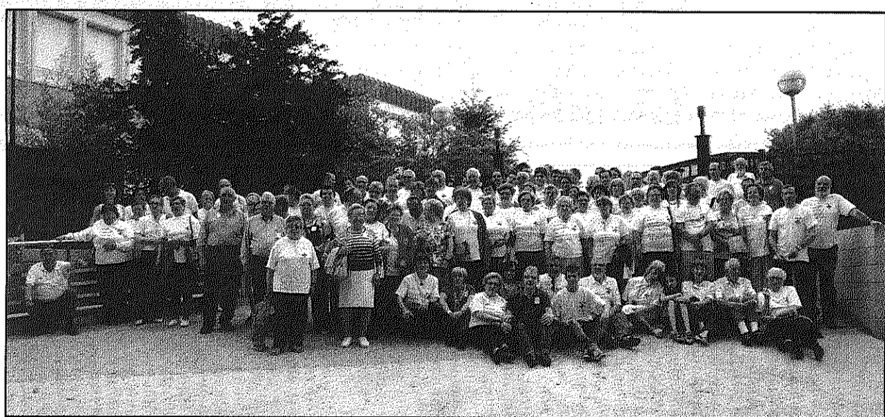
Una imatge dels voluntaris de Creu Roja de Sant Celoni i el Baix Montseny que van assistir al dinar (AdBM)

Per aquest motiu el president local de Creu Roja de Sant Celoni i el Baix Montseny va demanar la implicació i participació directa del voluntariat de base en el disseny i seguiment de nous projectes que permetin "donar resposta a les necessitats emergents". També va apuntar, finalment, la necessitat de "poder fer ben aviat un canvi generacional, a tots els nivells de direcció".