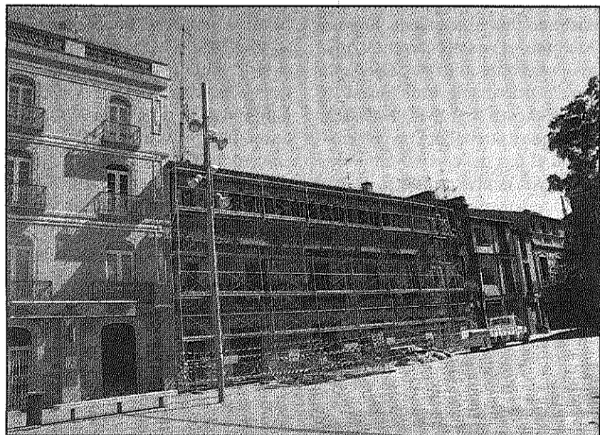
Una imatge dels treballs que s'estan fent a Can Ramis

REDACCIÓ. Sant Celoni A finals de la setmana passada van començar a Sant Celoni les obres de reforma de la façana de l'edifici de Can Ramis, uns treballs que van ser adjudicats a mitjans d'aquest mes a Construcció i restauració Jesús Pacheco per un import de 85.840 euros, Iva inclòs. Els treballs tenen per objectiu netejar la façana de l'edifici i reparar les juntures trencades dels blocs de pedra de l'entrada principal.