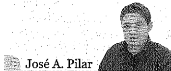
José A. Pilar Vallès Oriental

Trenta-sis consistoris de la comarca deuen a les entitats financeres 233,9 milions d'euros > Campins, Castellcir, Fogars, Montseny, Sant Quirze, Vallgorguina i Vilalba, a deute zero