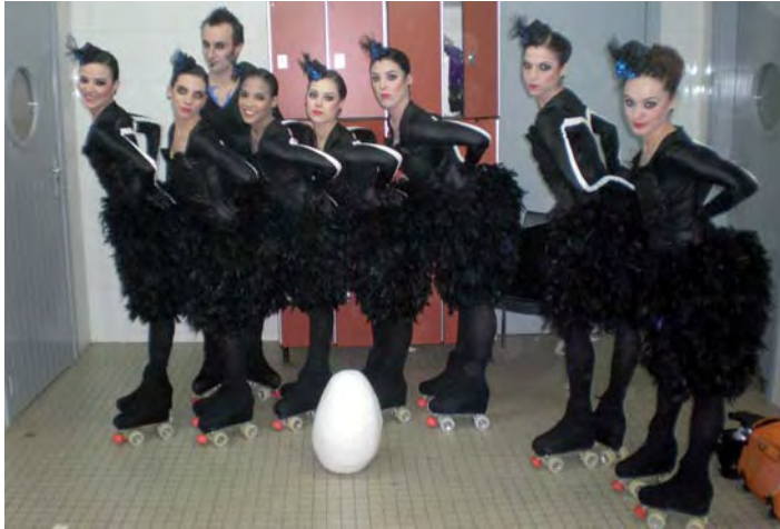
Plaer del Club Patí Sant Celoni va ser cinquè a Freiburg

SANT CELONI.- El Club Patí Sant Celoni no ha pogut pujar al podi del campionat del món de patinatge artístic en la modalitat de grups xous petits, celebrat a la ciutat alemanya de Freiburg.