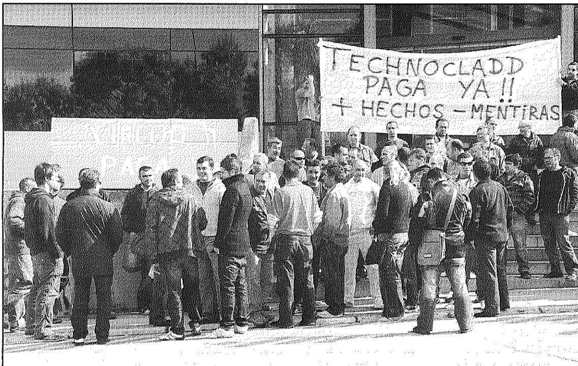
Els treballadors de Coperfil, Technoclad i Vircop a la concentració del passat 7 de maig

Segons els representants sindicals dels treballadors, com a mínim els deuen 3.500 euros de mitjana per persona i alguns dels treballadors de l'empresa i de les seves filials porten des del mes de setembre sense cobrar la nòmina. Els treballadors, que havien