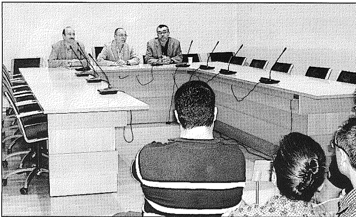
Una imatge de la recepció dels científics a l'Ajuntament per part de l'alcalde (L'AdBM)

Els investigadors han celebrat les sessions a l'Hotel Suis, on han informat dels avenços i treballs que desenvolupa, des de fa 10 anys, la Xarxa Espanyola d'Investigació