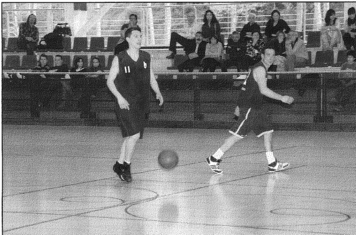
El CB Arbúcies tanca la campanya havent perdut tan sols dos dels 30 partits disputats (L'ADBM)

El CB Llinars va tancar la campanya de Segona catalana amb una victòria 55-40 davant el CB Farners que situa l'equip en una còmoda setena posició final i 16 victòries i 14 derrotes. La mala notícia al grup ha estat, per contra, el descens del CB Cardedeu malgrat va tancar la campanya amb una victòria 60-62 davant el CB Lliçà d'Amunt. Els de Cardedeu no han fet una bona temporada i prova d'això és que la tanquen amb un balanç final de només 4 victòries.