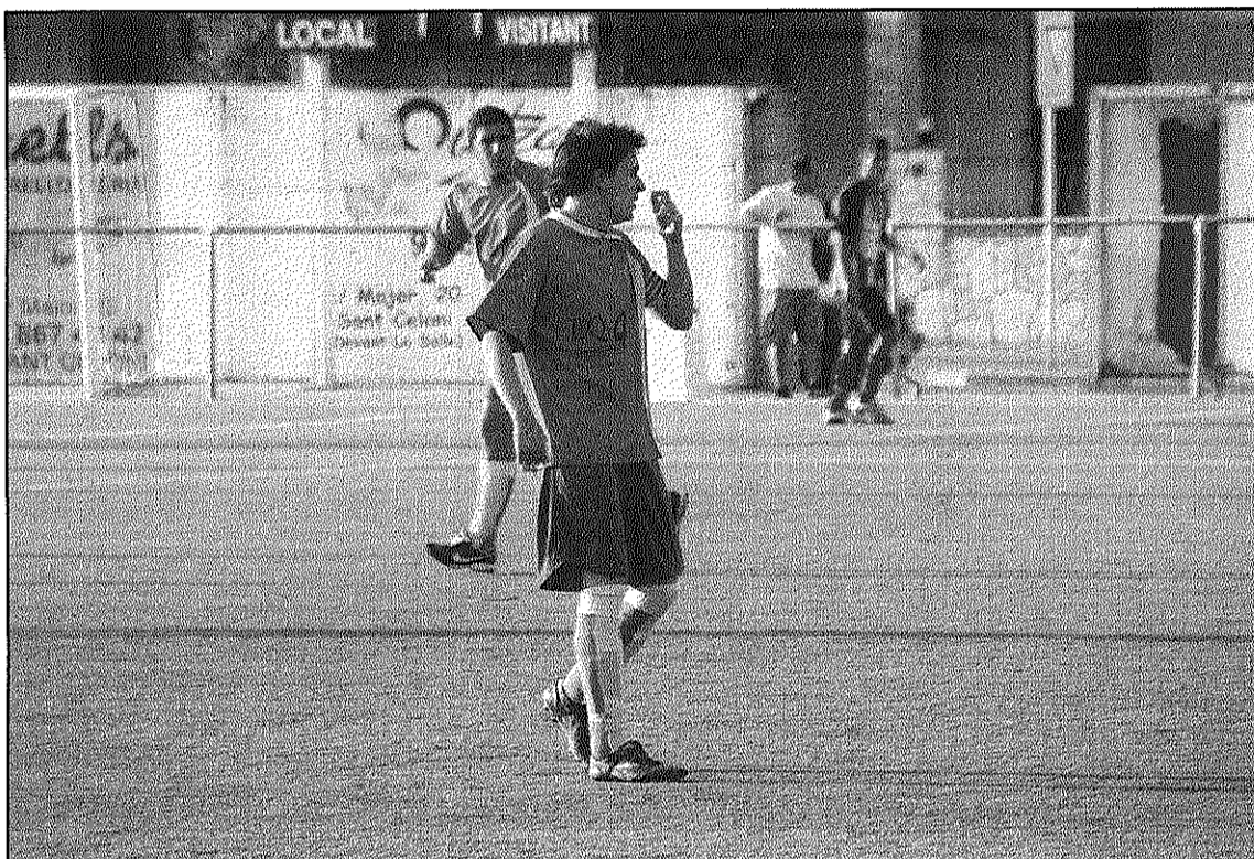
El Pitres dependrà del resultat entre l'Inacsa i l'US Corró d'Amunt en la seva lluita per pujar (L'AdBM)

Així, en cas de victòria batlloriana, la UD Pitres tindrà matemàticament la segona plaça abans de jugar el seu partit. En cas de victòria o empat de la US Corró d'Amunt davant el CD Inacsa, el Pitres necessitarà, almenys,