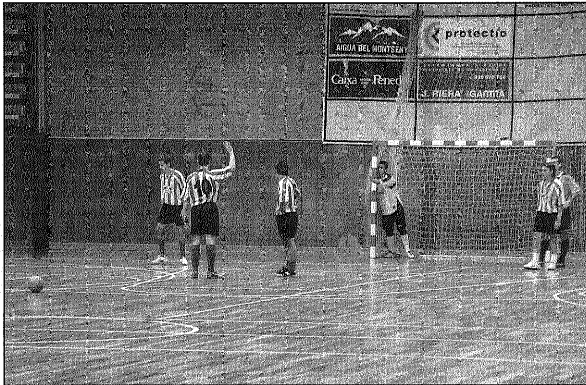
Els celonins tenen garantida la continuïtat al grup però no poden optar a la zona alta (L'ADBM).

Al grup tercer de Primera territorial, el CFS Vilamajor està obligat a vèncer en el compromís que jugarà aquest dissabte a casa, a les 8 del vespre, davant el FS Polinyà. La victòria davant el cuer pot permetre als de Sant Antoni seguir a l'encalç de la segona plaça malgrat que en la darrera jornada van caure per 4-1 davant el CFS Martorelles. Ja sense opcions, el FS Cardedeu juga diumenge, a tres quarts de 12 del migdia, a la pista del CFS Ràcing Mataró. Els cardedeuencs es