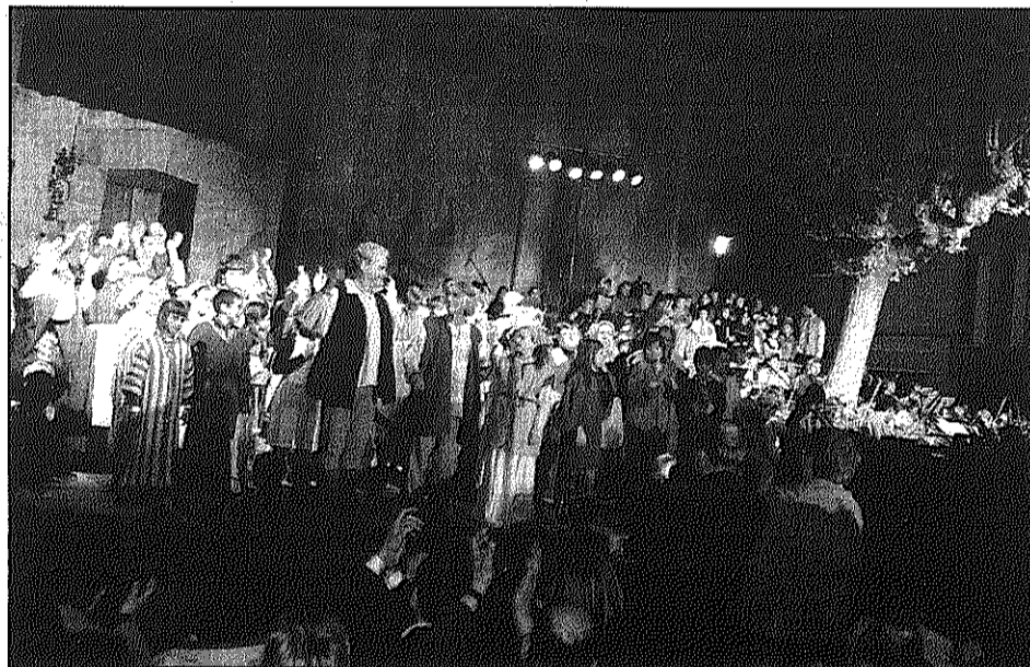
Una plaça de l'Església plena a vessar va ovacionar la posada en escena (L'AdBM)

REDACCIÓ. Sant Celoni La plaça de l'Església de Sant Celoni va viure divendres una nit emocionant amb la posada en escena de 'La llegenda d'una espasa' per commemorar el 5è aniversari del Centre Municipal d'Expressió (CME). La interpretació de l'obra, basada en el mite local Soler de Vilardell, amb 140 músics, desenes d'actors i un cor infantil amb 130 nens i nenes, va emocionar els més