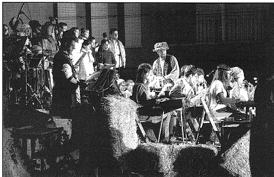
Els alumnes de l'Escola de Música van interpretar peces inèdites (L'AdBM)