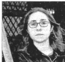
La poeta Elena Medel.

El domini sorprenent del llenguatge poètic que té Medel es confirma en el seu poemari més recent, Tara , en el qual tot gira al voltant del sentiment de la pèrdua d'una persona estimada, una àvia a qui la poeta deu una bona part de la seva personalitat i dels moments més feliços de la seva vida. S'ha produït una ruptura en la poesia de