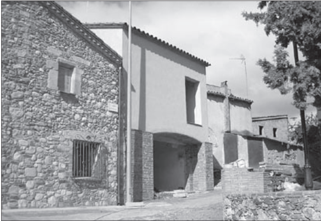
El punt d'informació està situat a la zona històrica de Sant Pere de Vilamajor

La Diputació aportarà un fons per garantir el funcionament de l'equipament, que disposarà d'atenció al públic els dissabtes i festius de les 10 del matí a les 2 del migdia. Per a l'Ajuntament de Sant Pere, el punt d'informació serà un dels més rellevants del Parc del Montseny i combinarà la vessant informativa amb la producció de publicacions divulgatives i