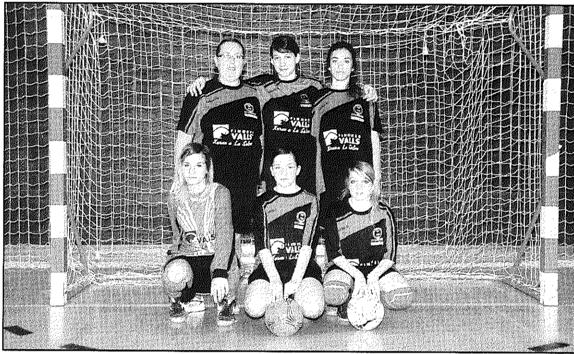
L'equip femení del FS Arbúcies juga aquest dissabte a la pista del FS Sabadell (L'AdBM)

rial, el CFS Sant Hilari juga dissabte, a les 4 de la tarda, a la pista del CE FS Vidreres, el penúltim classificat. Els de Sant Hilari van empatar en la darrera jornada 8-8 el CFS Roses. El CFS Hostalric també jugarà aquest cap de setmana fora amb un desplaçament complicat. Serà dissabte, a les 8 del vespre, a la pista del Futsal Puigcerdà, líder de la classificació.