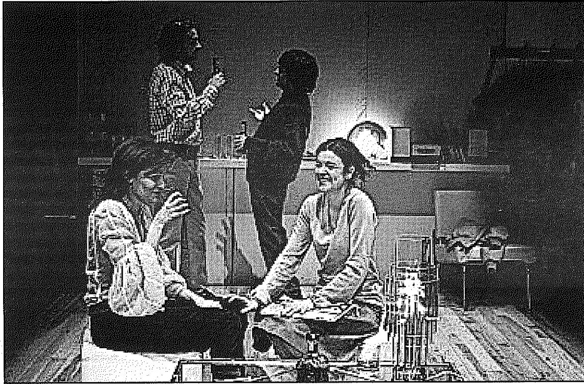
Una imatge de l'obra 'La forma de les coses' que es representa dissabte a l'Ateneu