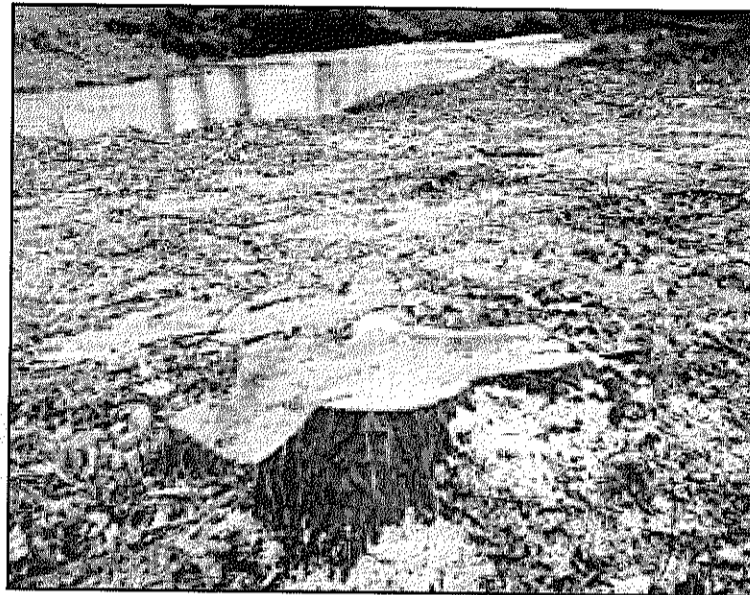
Les restes de l'alber talat al terme de Sant Celoni (CSM)

D'altra banda, la Coordinadora per a la Salvaguarda del Montseny també ha denunciat la tala d'un gran àlber a l'alçada de San Pàmies, que es trobava situat al terme municipal de Sant Celoni. Segons la Coordinadora, l'àlber tenia unes mides considerables i era