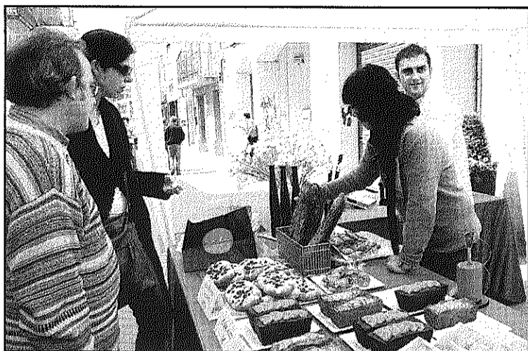
Parades de tot tipus de productes van omplir la Fira (L'AdBM)

Les Botigues al Carrer van comptar amb altres elements que van sumar en l'èxit de la