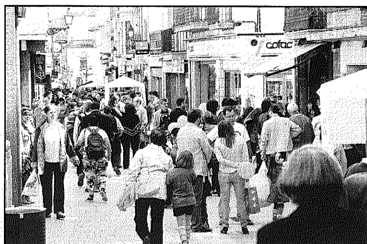
Centenars de persones es van passejar entre els expositors (L'AdBM)