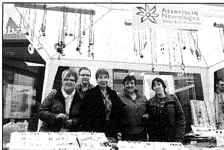
Entitats com l'Associació Neurològica, presents a la Fira (L'AdBM)

jornada. Quatre entitats van organitzar, també, la seva pròpia parada per difondre les activitats que porten a terme i adquirir fons per als projectes que impulsen, com l'Associació Neurològica Amics del Baix Montseny o el Club de Ball Celodance. El Club Arc Sant Celoni, a més,