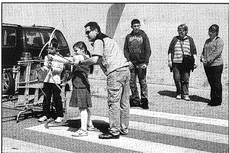
L'Arc Sant Celoni va participar amb una parada de tir (L'AdBM)