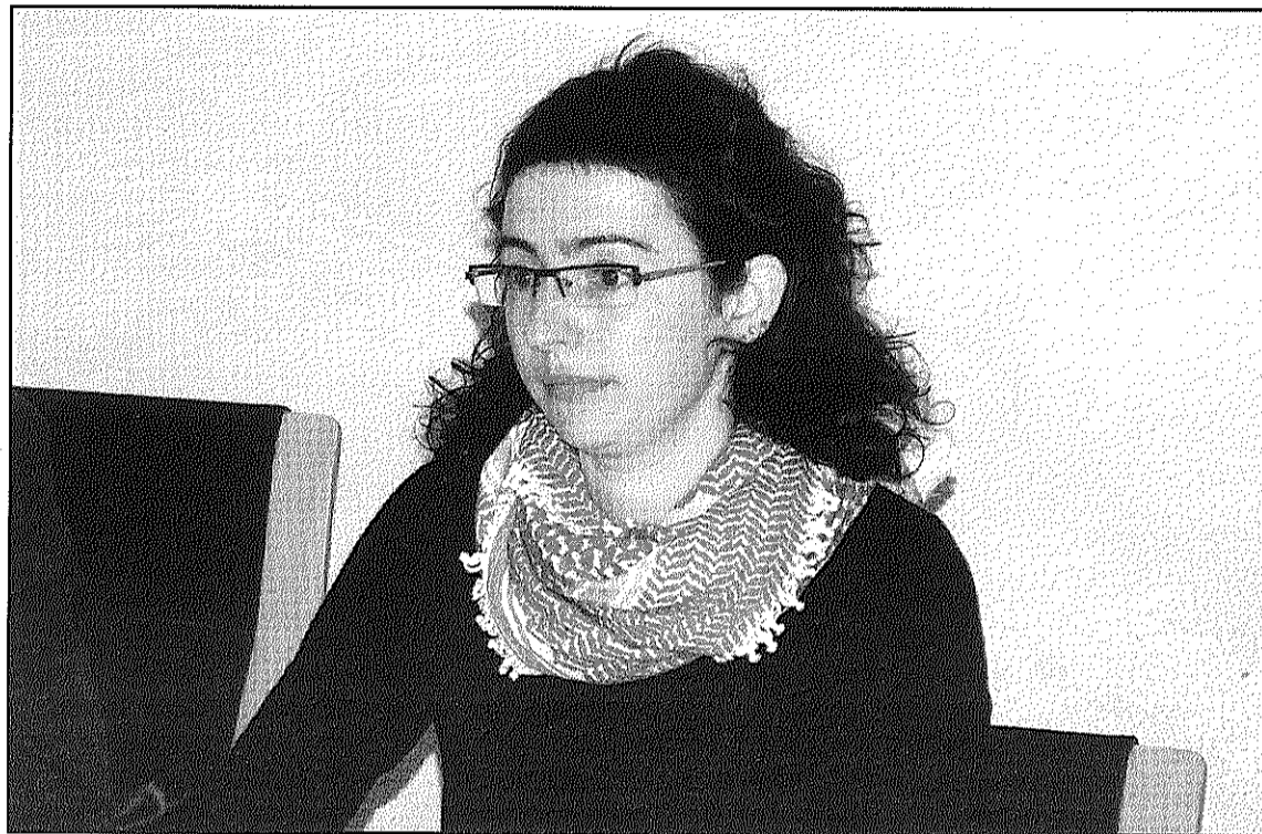
La formació ha elaborat un document amb les incorporacions a la proposta del govern (L'AdBM)

persones la formació centra les seves prioritats en la redacció d'un Pla local de cohesió social per eradicar la pobresa; la coordinació entre serveis socials i serveis comunitaris, altres regidories i altres ajuntaments; ampliar els ajuts d'emergència dels 14.500 euros destinats el 2009 fins a 30.000 euros i incloure-hi ajuts en menjador escolar,