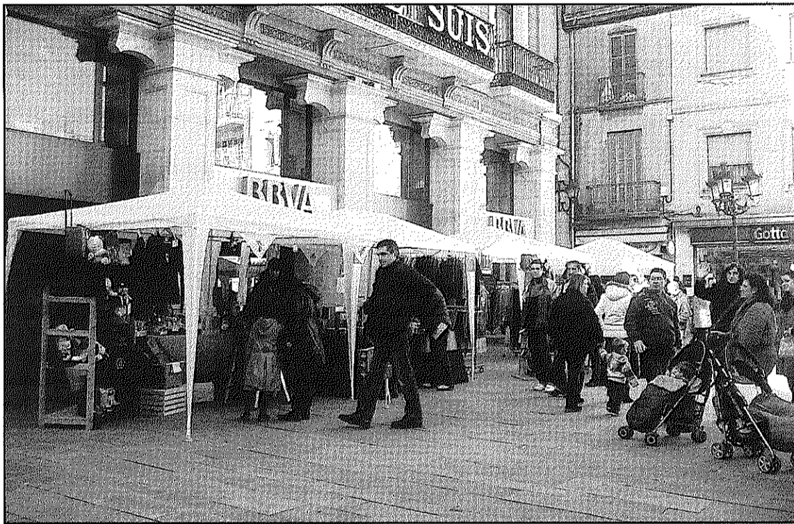
Sant Celoni Comerç dona un impuls important a la fira, on participaran tots els sectors

Precisament, serà a la plaça de la Creu on començarà l'exposició de vehicles dels concessionaris d'automoció que participen a la fira. El circuit de parades, ha assenyalat Sant Celoni Comerç, s'allargarà en aquesta edició fins a la plaça del Bestiar, un espai on al matí s'oferiran diverses actuacions organitzades per l'Escola de