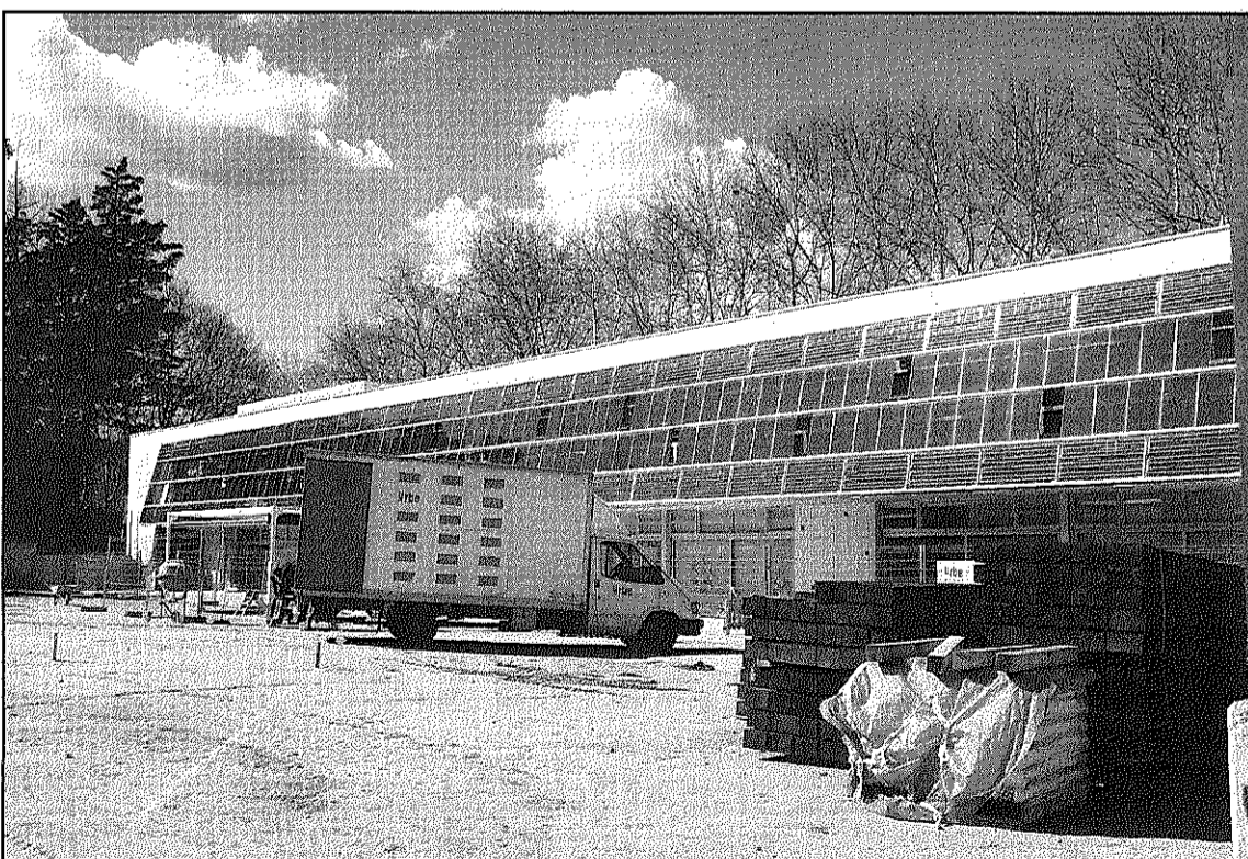
L'empresa adjudicatària ja ha començat a treballar en l'adequació del pati del Blauet