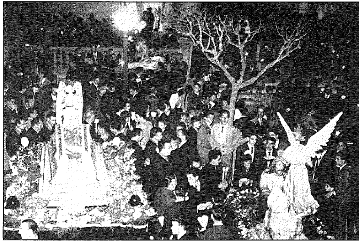
Una de les fotografies que es podrà veure a 'Processons i benediccions d'abans' (Josep M. Cortina)

La mostra fotogràfica es podrà visitar fins el 18 d'abril a la Rectoria Vella