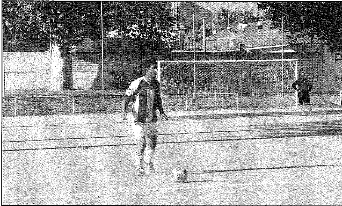
El CD Inacs de la Batllòria va fer gala del seu millor futbol imposant-se al CD Figaró (L'AdBM)

Dissabte, a dos quarts de 5 de la tarda, el CD Inacs té un