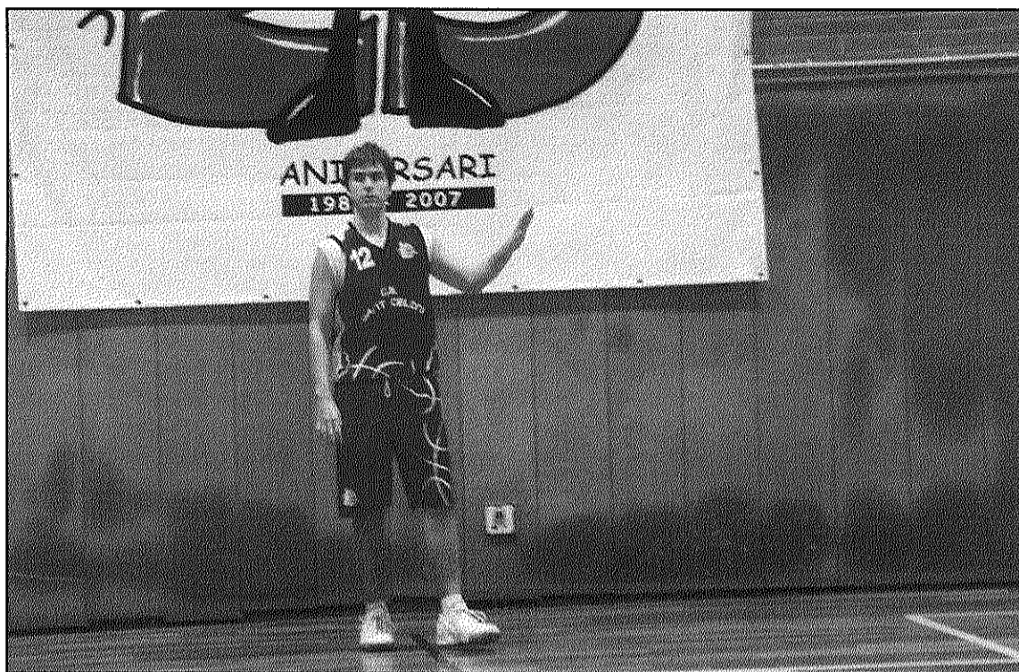
El CB Sant Celoni conserva les opcions per col·locar-se en el grup de promoció (L'AdBM)

A Tercera catalana, el CB Sant Celoni té un desplaça-