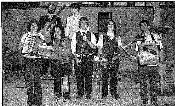
L'Orquestra Sant Celon actua dissabte a l'Ateneu celoní (L'ADBM)

REDACCIÓ. Sant Celoni Aquest dissabte, a les 11 de la nit, se celebra a la sala petita de l'Ateneu una nova edició del Sessions'n'Sona amb les actuacions de les bandes locals Zzaz i Orquestra Sant Celoni. Zzaz es defineix com un grup de latin jazz, adaptat a les influències tropicals i europees, que barreja estils que van des de la samba fins al