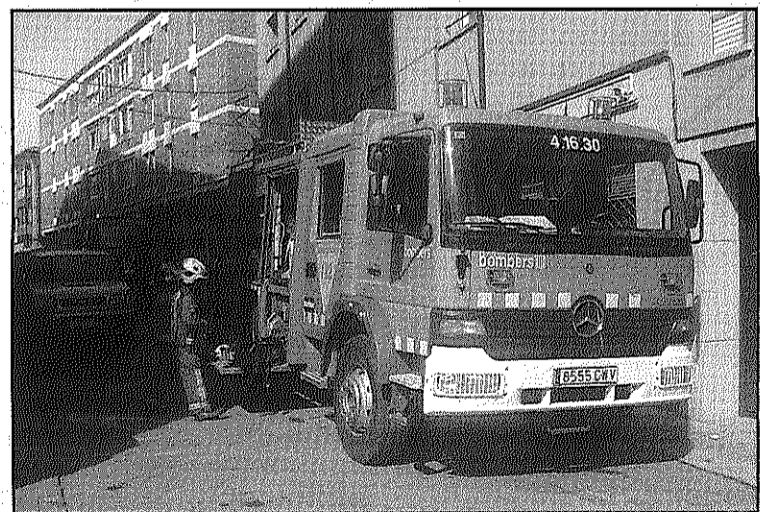
Els Bombers al lloc de l'incendi, dimarts (L'AdBM)

REDACCIÓ. Sant Celoni L'incendi a la campana de l'extractor d'un domicili particular de Sant Celoni, al carrer Abat Oliba, va mobilitzar dimarts al migdia dues dotacions del Parc de Bombers de Sant Celoni. L'avís es va rebre a les 13:22 quan els titulars de l'habitatge van avisar de l'incendi. En arribar els efectius el foc s'havia apagat sense que es produïssin ferits, però la cuina va quedar afectada pel