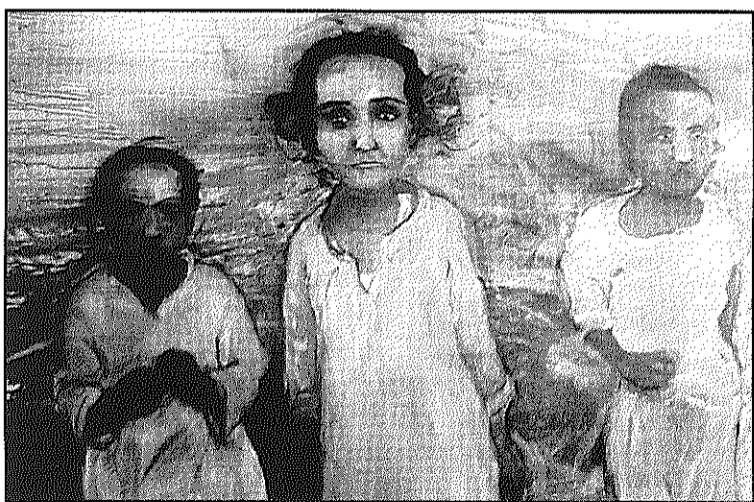
Una obra de Ramos que es podrà trobar a la mostra

REDACCIÓ. Sant Pere de Vilamajor L'artista colombià, original de Cali, Toni Ramos, inaugura aquest dissabte, a les 12 del migdia, l'exposició que es podrà visitar fins el 27 de març al Centre d'Art la Rectoria. L'artista presenta una selecció de pintures englobades sota el títol de 'Som nosaltres?' per fer un recorregut per les petjades de la vida, les empremtes del pas