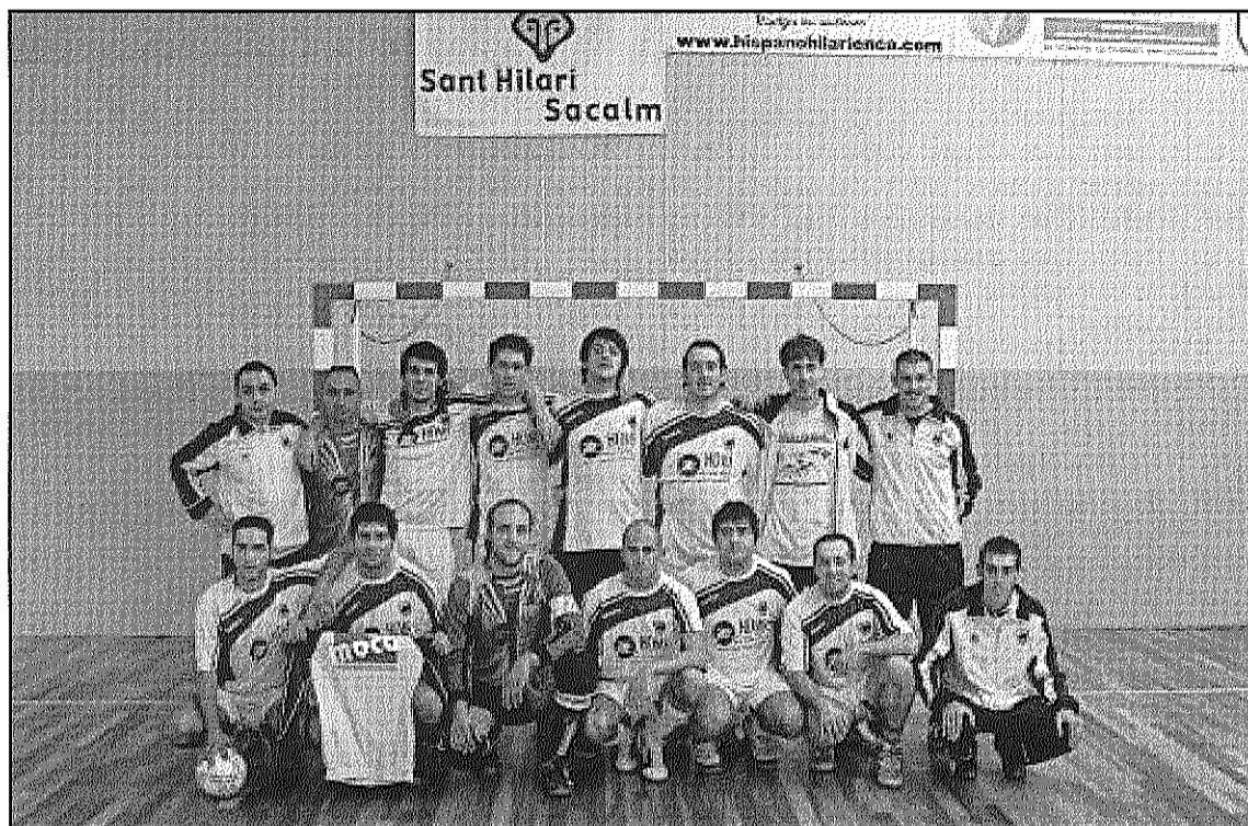
La plantilla del primer equip del FS Sant Hilari, que jugarà davant el líder del grup (L'AdBM)

Al grup segon de Segona territorial A, el CF Palauenc visita dissabte, a dos quarts de 7 de la tarda, al FS Castellar, de la zona baixa. Al grup tercer,