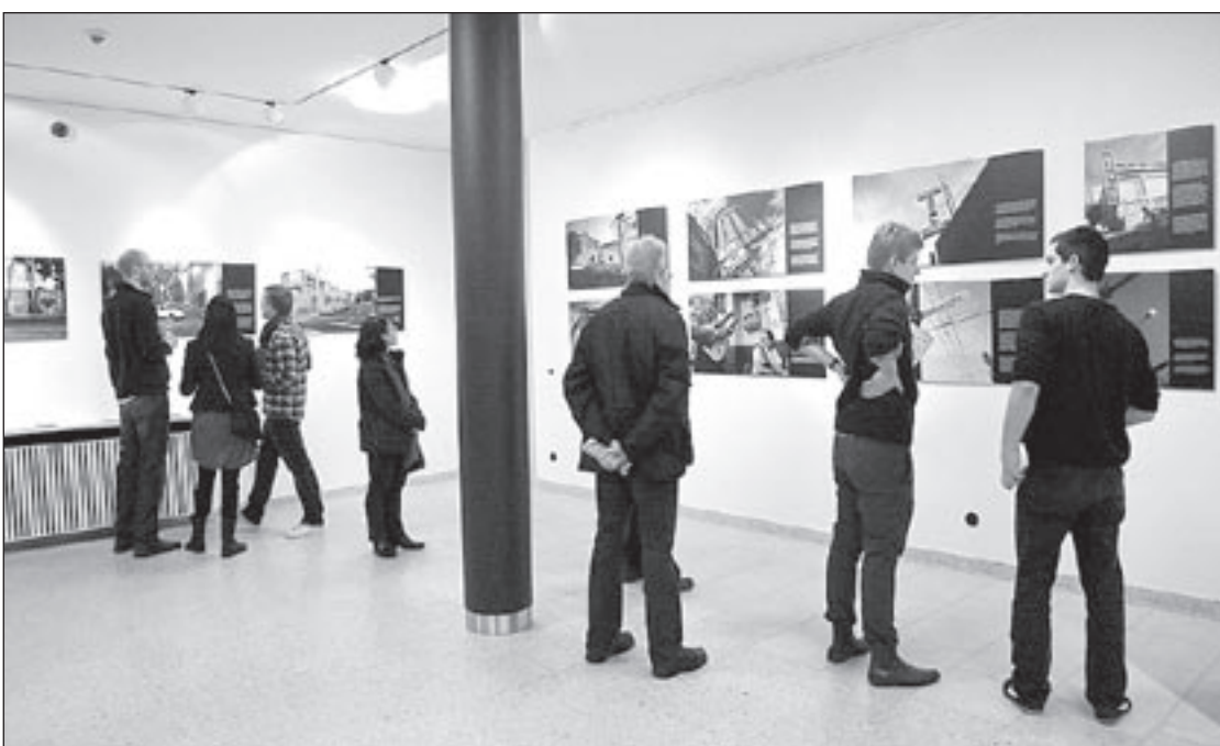
La inauguració de la mostra es va fer dijous passat

Les fotos exposades formen part també d'un llibre que publicarà Tropo Editores properament, amb textos de Dúnia Gras i Leonie Krentler.