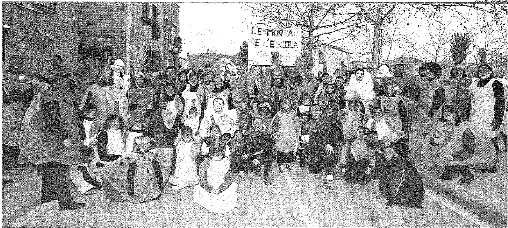
L'ESMORZAR DE L'ESCOLA CAMINS, PREMIADO EN LES FRANQUESES DEL VALLÈS. Apostando por una comida sana para sus alumnos, la Escola Camins de Les Franqueses del Vallès mereció el primer premio que concedía el Ayuntamiento (400 euros), convirtiendo a los participantes en apetitosas frutas... garantía de una alimentación sana y saludable. Buena participación en todos los desfiles de Les Franqueses del Vallès.