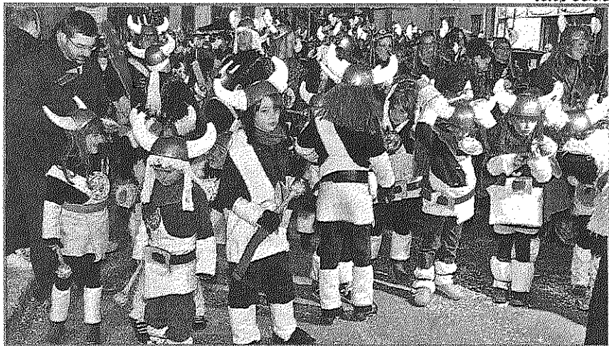
EN LA GARRIGA, 14 COMPARSAS... Satisfacción por la buena participación de comparsas en la Rúa de La Garriga, que contabilizó un total de 14 comparsas. En total se entregaron una docena de premios, con temas bien diferentes tanto en el caso de los más pequeños como de los mayores: vikingos, vestidos de época, fantasmas, hippis... Buena imaginación y ganas de pasarlo bien no faltaron en esta población, acostumbrada a las fiestas de Carnaval desde hace muchos años.