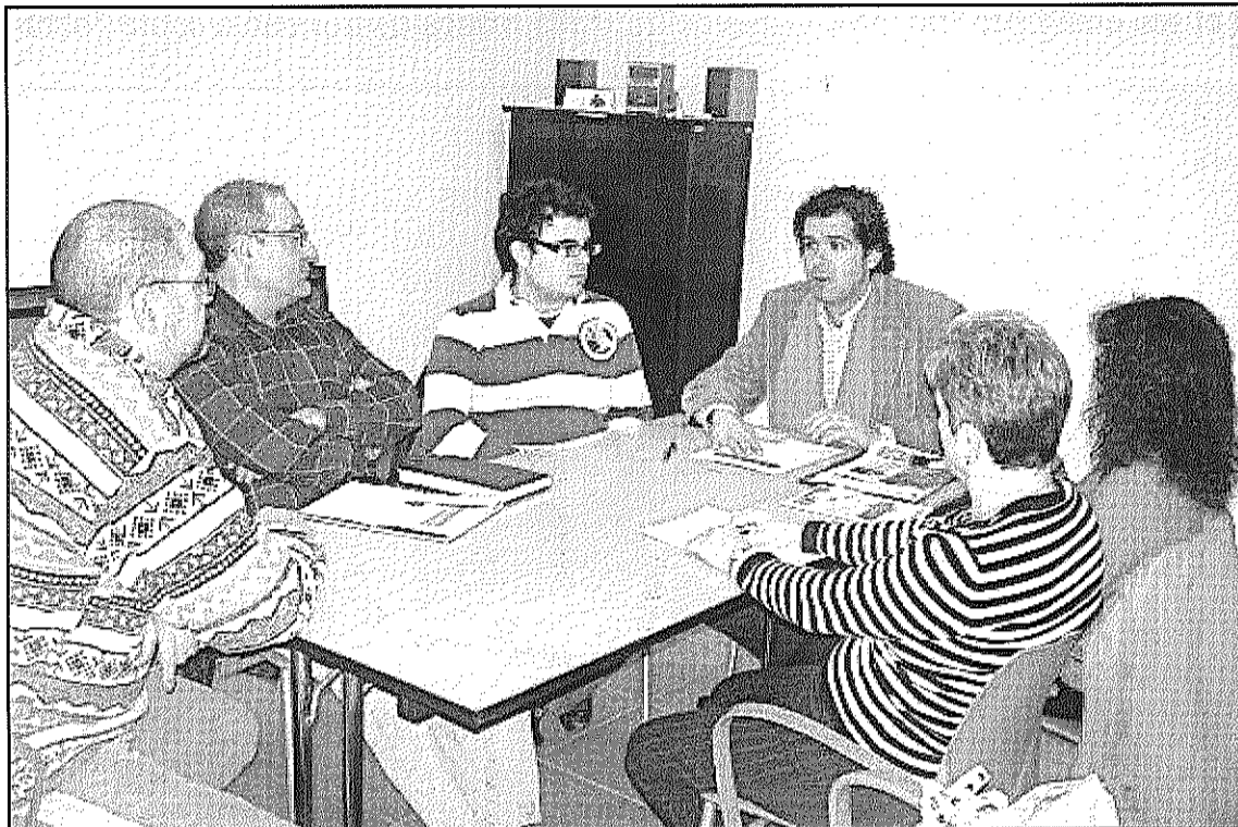
La reunió de la Comissió transversal econòmica celebrada dimarts a la Batllòria (L'AdBM)

La Comissió transversal espera l'esborrany del Consistori per tancar propostes