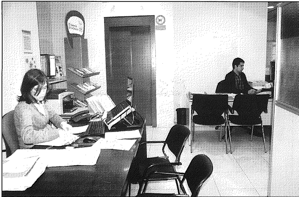
Treballadors de l'Oficina Municipal d'Habitatge de Sant Celoni, situada al Safareig (L'AdBM)

De les més de 1.000 persones que han demanat informació sobre ajuts per risc d'exclusió, l'Oficina Local d'Habitatge va tramitar-ne 283, un 73 per cent més que el 2008 (162 ajuts). La majoria dels sol·licitants són de Sant Celoni (un 61 per cent), i la resta de Santa Maria de Palautordera (un 17 per cent) i de Llinars (un 11 per cent). Segons el Consistori l'incre-