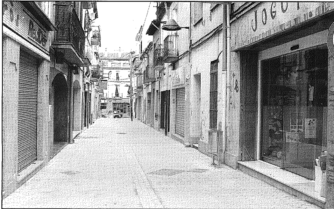
La major part d'habitatges buits es troben al carrer Major i als seus adjacents (L'AdBM)

L'estudi ha permès detallar la situació dels habitatges que, segons un estudi preliminar fet la primera meitat del 2008, apuntava inicialment a l'existència de fins a 461 habitatges buits. El treball de camp realitzat des d'aleshores ha permès detallar amb major precisió la situació d'aquests habitatges dels quals només 240 estan, segons l'Ajuntament, desocupats. D'aquests, a més, 185 estan buits, 31 es troben en venda o en lloguer,