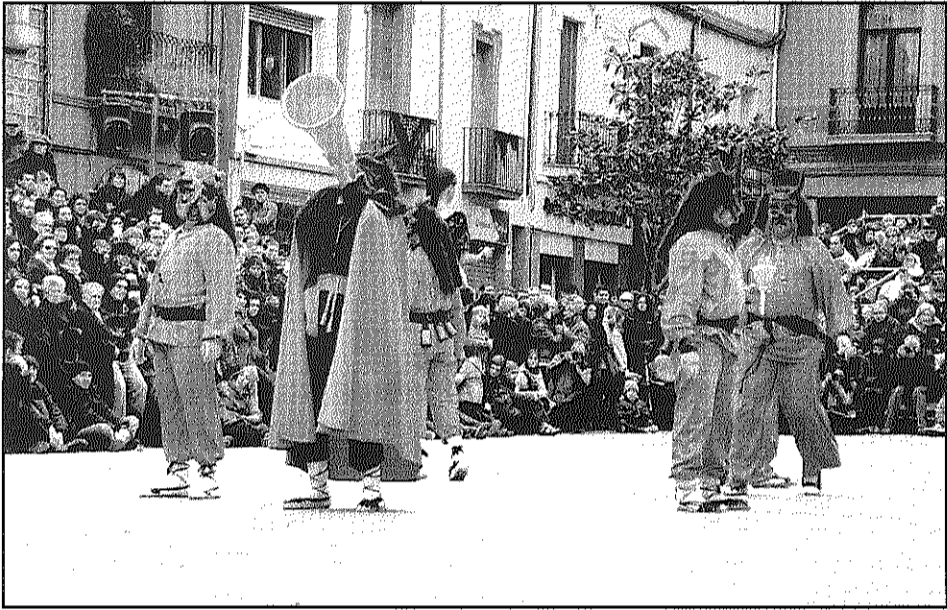
Els Diablots simulen amb un gegant el so dels petards a la plaça (L'AdBM)