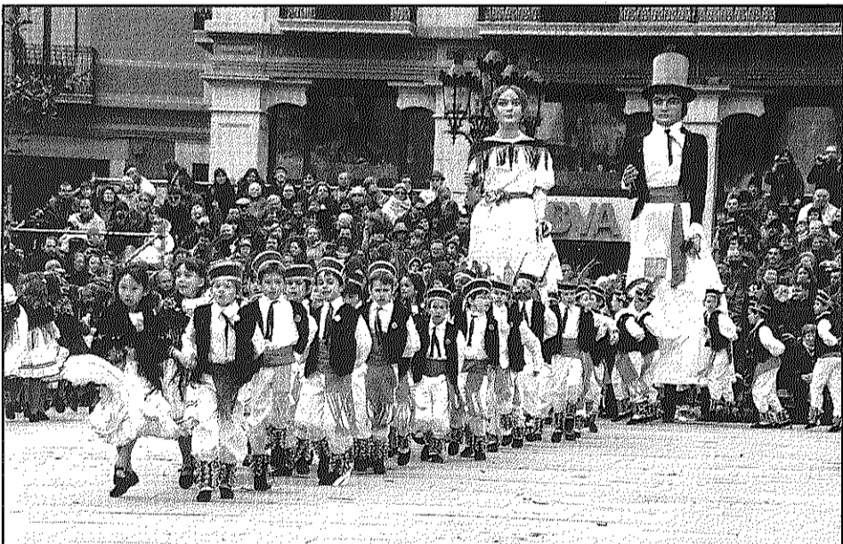
Els gegants de Sant Celoni van acompanyar el Filferro vestits de gitanes (L'AdBM)