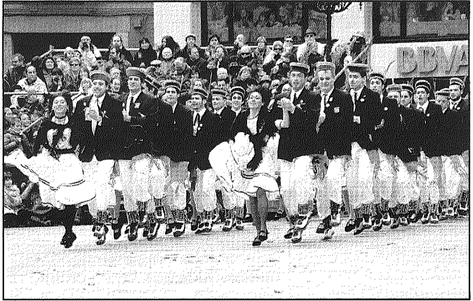
Entrada a la plaça de la Vila de la Colla del Ferro (L'AdBM)