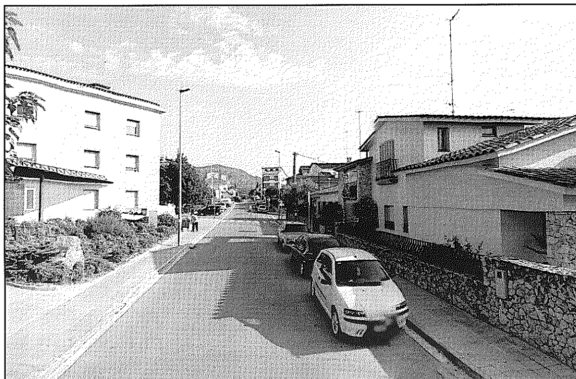
El Consistori considera que el canvi dels llocs d'aparcament afavorirà la seguretat viària

REDACCIÓ. Sant Celoni L'Ajuntament de Sant Celoni ha anunciat de la seguretat viària del carrer de Diputació, en els propers dies, entre l'avinguda Verge del Puig i el carrer de Santa Tecla. L'objectiu, assenyala el Consistori, és reduir la velocitat dels vehicles i per aquest motiu es canviarà de costat l'aparcament del tram que va de l'avinguda Verge del Puig al carrer Germà Emilià. Entre el carrer de Consell de Cent i el de Santa Tecla es prohibirà, a més, l'aparcament per millorar la visibilitat d'incorporació des d'aquest darrer carrer i, alhora, facilitar els moviments d'aparcament del CAP i de sortida de vehicles als guals del davant. La proposta, segons l'Ajuntament, es va presentar a una àmplia representació del veïnat a finals d'any i es completarà més endavant amb un projecte d'adequació del tram següent del carrer Diputació, entre els car-