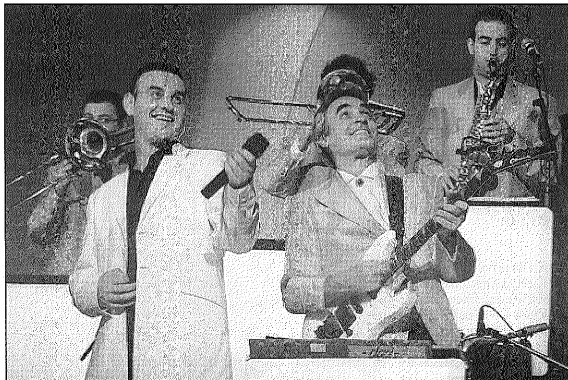
L'orquestra Maravella actua diumenge, a les 6 de la tarda, a l'Ateneu de Sant Celoni (L'AdBM)

Els socis de l'Esplai podran gaudir de descomptes sobre el preu de l'entrada