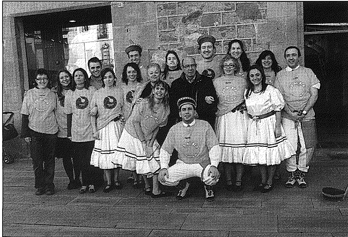
Dotze parelles iniciadores del Filferro, el 1986, van fer una ballada especial diumenge passat (L'ADBM)

I és que aquest diumenge, a la tradicional ocupació de la plaça dels singulars personatges de Gitanes, com els Diablots, el Vell i la Vella, o el Capità de Cavalls, la colla del Filferro serà protagonista per aquest quart de segle d'existència. També ho serà la Colla del Ferro, que enguany celebra la seva trentena ballada.