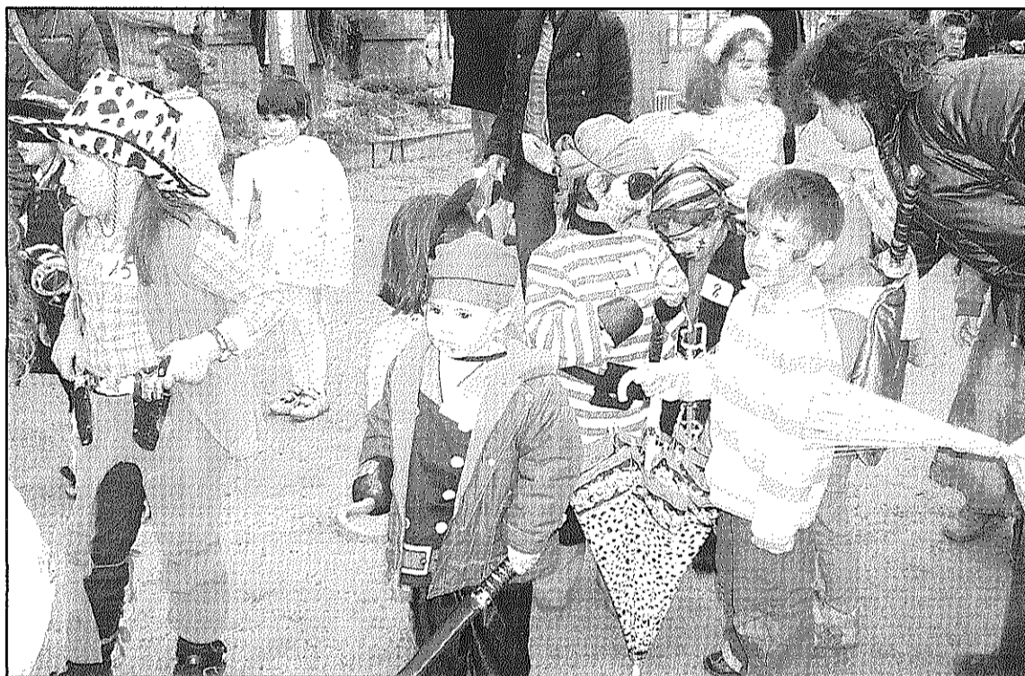
Nombrosos municipis de la comarca premiaran les disfresses i les carrosses més originals (L'AGEBM)

Per la seva banda, Breda va començar la celebració el cap de setmana passat, amb una cercavila, el pregó i tallers infantils per preparar les disfresses d'aquest cap de setma-