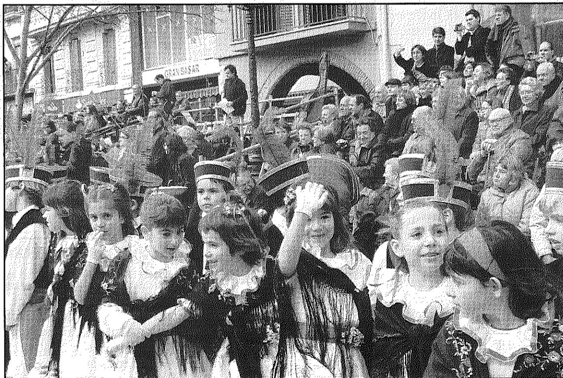
Filferro, Ferro i les colles de Sant Esteve i Llinars ballen juntes diumenge a Sant Celoni (L'AGBM)

Veure les quatre colles ballant a la plaça de la Vila serà un fet insòlit, ja que totes tenen cita de gitanes diumenge vinent als respectius municipis coincidint amb el Carnestoltes.