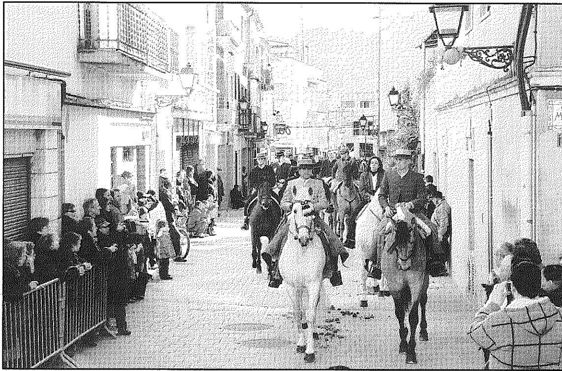
Cavalls i carruatges ompliran diumenge el centre de la vila per celebrar els Tres Tombs (L'AdBM)

S'espera que uns 15 carruatges i una quarantena de cavalls participin a aquesta edició de la festa. Els participants sortiran del Sot de les Granotes, passaran pel carrer Lluís Companys, Doctor Trueta, carretera Vella i pujaran pel carrer Sant Pere fins a la plaça de l'Església on es farà la benedicció. Seguidament es continuarà el recorregut