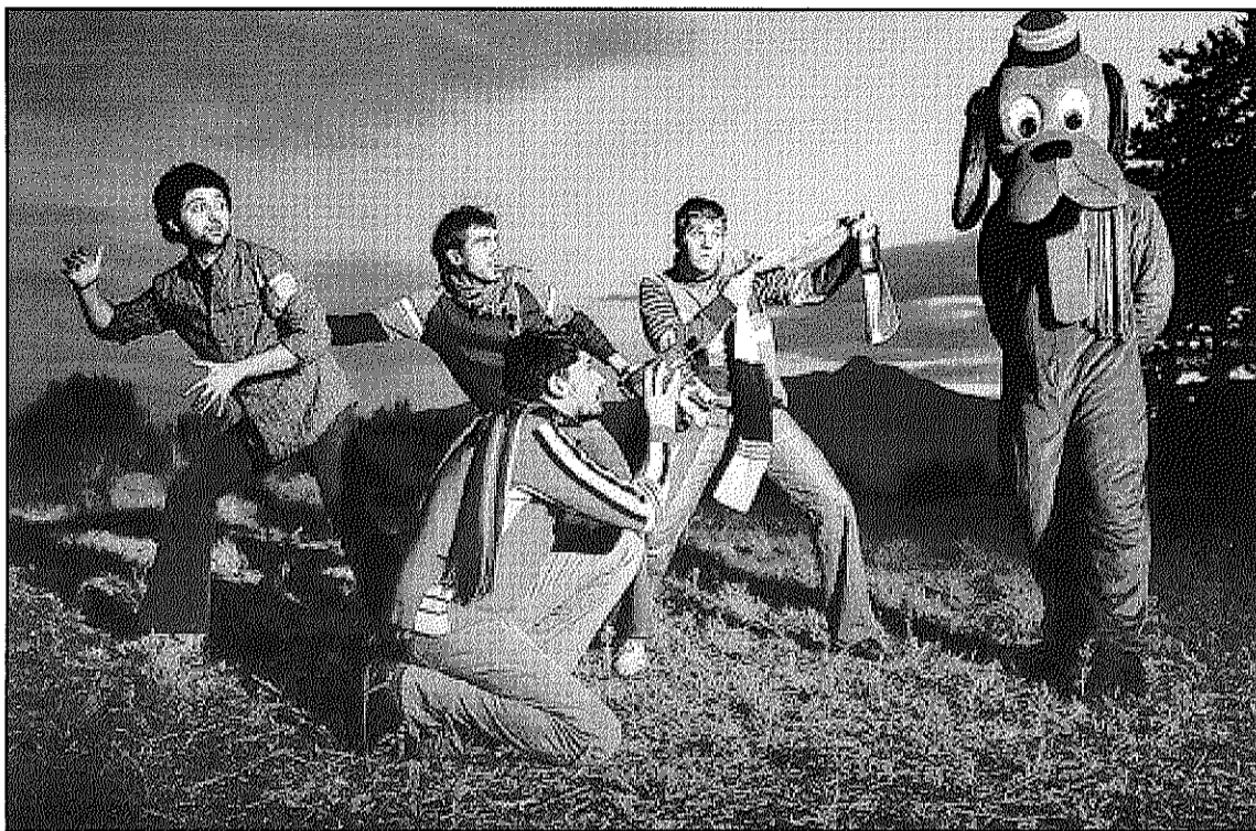
Els amics de les Arts obren avui, juntament amb Senior i el cor brutal, el Tastautors 2010 (L'AGBM)

El segon concert està previst pel 22 de gener amb els conjunts La increïble Història d'en Carles Carolina i Delèn, també a la Sarau. El mateix espai acollirà, el 29 de gener, l'actuació de Menaix a Trua i Esteve Felipe. El 5 de febrer al bar Tarambana s'hi desenvoluparà el Taller 'Guillamino