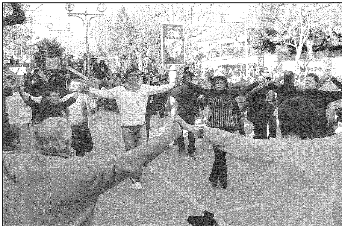
Una imatge de l'audició de sardanes de la Jovenívola de Sabadell a Sant Celoni (L'ADBM)

Al concert, la Jovenívola de Sabadell va oferir una primera part de composicions clàssiques i una segona de integrada per peces més contemporànies. Entre els temes que es van poder escoltar