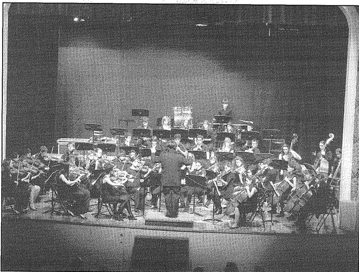
Una imatge del concert dels Alevins de les JONC a l'Ateneu de Sant Celoni (L'AdBM)

El concert estava organitzat per l'AMPA de l'Escola Municipal de Música