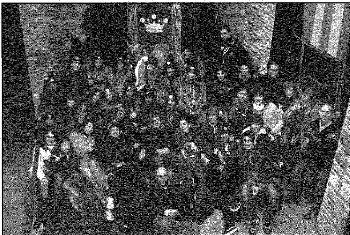
El patge reial i els seus col·laboradors a la Torre de la Força de Sant Celoni

D'altra banda, la cavalcada celebrada pels carrers del municipi la nit del dia 5 també va tenir una molt bona acollida. Una fina pluja va fer témer, en primera instància, que no s'hagués de suspendre la visita dels reis mags a Sant Celoni. Finalment, però, tot va quedar en una falsa alarma i nens i nenes van poder viure amb plenitud aquesta nit de màgia.