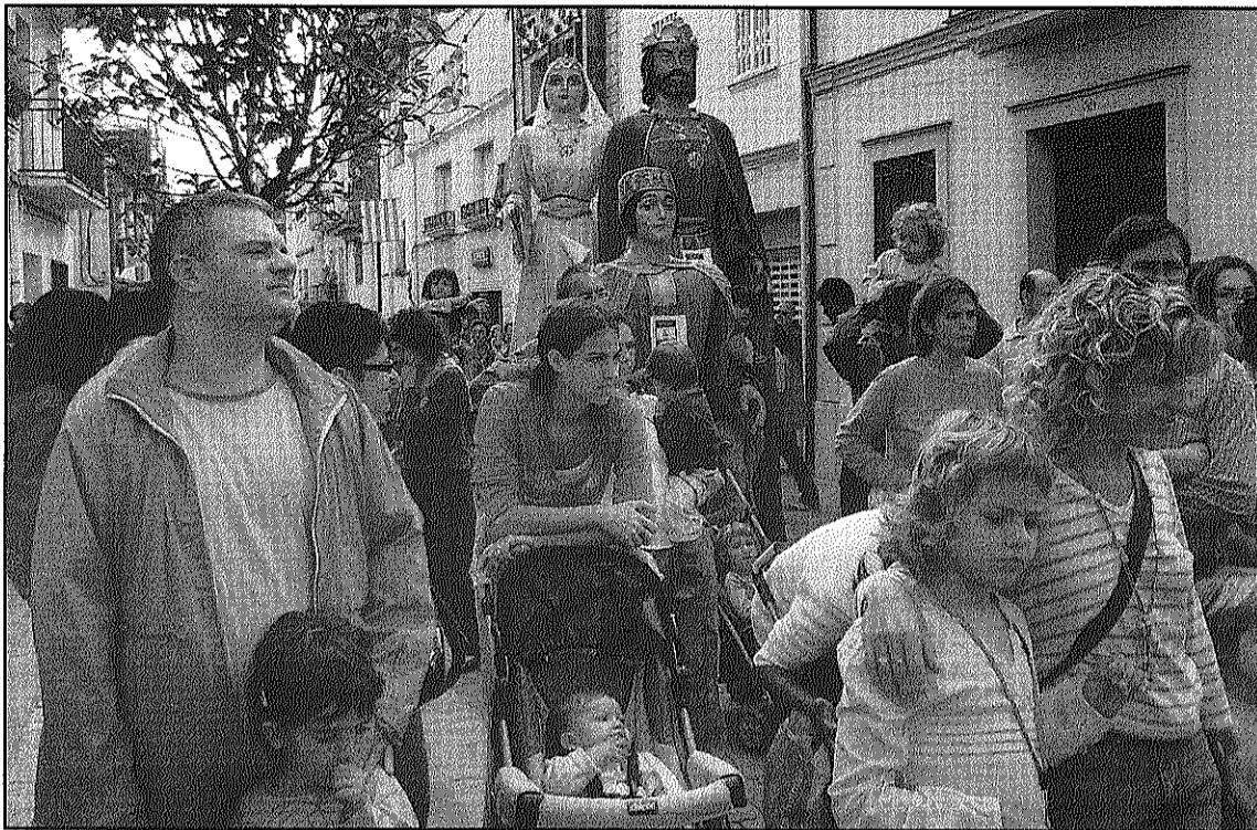
Els gegants de Santa Maria de Palautordera s'acompanyaran de la titella 'Lo monstre' (L'ADBM)

El suport de la Diputació de Barcelona també serà present a les obres de teatre 'L'habitació de Verònica', 'Nixon-Frost' i 'Petita feina per a pallaso vell', que comencen des d'avui, divendres, a fer gira pels escenaris catalans. La primera estrena serà al Casal Cultural de Castellbisbal on 'L'habitació de Verònica', un 'thriller' de la companyia Shankara Teatre presenta avui. També avui arrenca, a