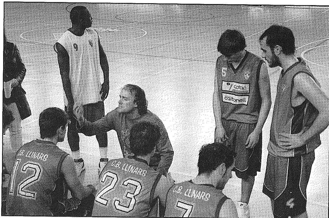
El CB Llinars té a la punta dels dits no haver de patir el que resta de temporada (L'AGBM)

A Tercera catalana, després de la derrota de la setmana anterior davant el CB Tordera, el CB Sant Celoni va tornar a guanyar per un marcador prou contundent a la pista del CB Parets. Aquesta victòria fa que l'equip és mantingui a la cinquena posició de la classi-